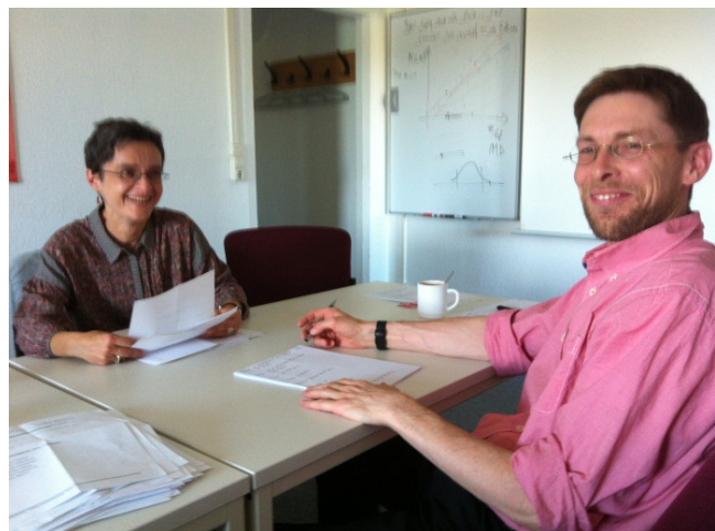
Wahlkommission im Eustress

Die Wahlkommission traf sich am 2. September in Greifswald und hat insgesamt 1471 gültige Kreuze auf den Stimmzetteln ausgemacht. Die Verteilung der Stimmen auf die KandidatInnen wird auf der Mitgliederversammlung bekanntgegeben.