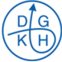
Deutsche Gesellschaft für Krankenhaushygiene e.V. (DGKH)

Diese Stellungnahme wurde von Vertretern der DGKH, der DGKJ und des DNEbM initiiert und von der AWMF und den weiteren aufgeführten Fachgesellschaften (insbes. DGEpi) finalisiert. Alle aufgeführten Fachgesellschaften unterstützten diese Stellungnahme (Ansprechpartner siehe Schluss).